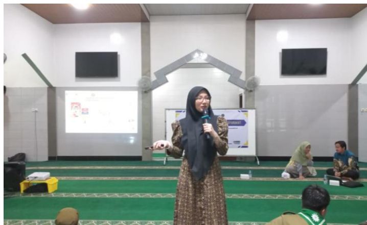
Gambar 2. Pemaparan Materi oleh Narasumber Pertama

Selain itu, materi menekankan pentingnya keamanan dan perlindungan identitas digital. Siswa dibekali pemahaman mengenai penggunaan kata sandi yang kuat, autentikasi dua faktor, pengelolaan identitas digital, serta kewaspadaan dalam menggunakan jaringan publik. Pemahaman ini menjadi langkah preventif untuk mencegah penyalahgunaan data yang berpotensi menimbulkan kerugian finansial maupun sosial. Literasi digital juga dikaitkan dengan aspek etika dan akhlak dalam bermedia. Narasumber menekankan bahwa aktivitas digital tidak terlepas dari nilai moral dan tanggung jawab sosial. Kesadaran bahwa jejak digital bersifat permanen mendorong siswa untuk lebih berhati-hati dalam berinteraksi di ruang digital, menghormati privasi orang lain, serta menghindari penyebaran konten negatif dan hoaks.