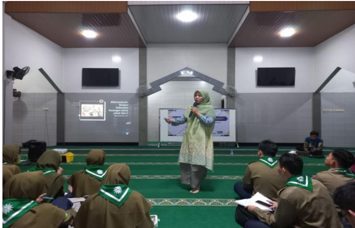
Gambar 3. Pemaparan Materi oleh Narasumber Kedua