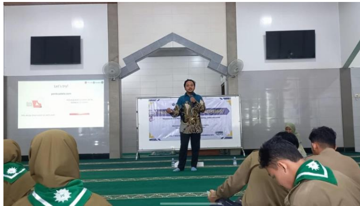
Gambar 4. Pemaparan Materi oleh Narasumber Ketiga

Setelah siswa memperoleh pembekalan materi dari ketiga narasumber, diperlukan evaluasi untuk menilai dampak kegiatan terhadap pemahaman siswa. Evaluasi tersebut dilakukan melalui perbandingan hasil pre-test dan post-test yang menggambarkan kondisi pemahaman siswa sebelum dan sesudah kegiatan berlangsung dapat dilihat pada gambar 4 berikut ini: