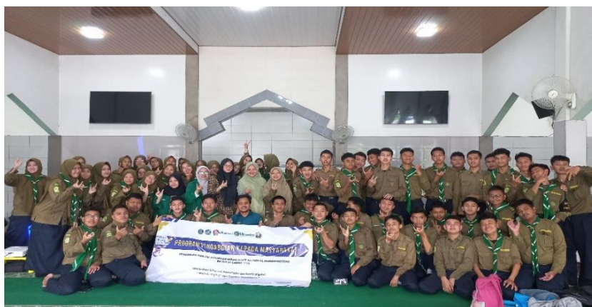
Gambar 6. Foto bersama

Sebagai penutup, berdasarkan hasil jawaban siswa dan siswi pada survei kepuasan, kegiatan pengabdian kepada masyarakat ini memperoleh respons yang sangat positif. Sebagian besar siswa menyatakan sangat puas terhadap pelaksanaan kegiatan serta merasa memperoleh banyak pengetahuan dan pengalaman baru. Kesan positif yang disampaikan siswa menunjukkan bahwa kegiatan PKM ini dinilai bermanfaat, relevan dengan kebutuhan mereka, serta mampu meningkatkan kesadaran dalam menyikapi risiko keuangan dan digital di era teknologi, dokumentasi penutup foto bersama disajikan pada gambar 6.