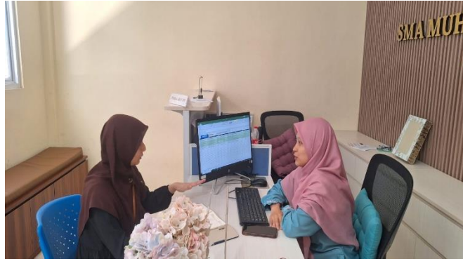
Gambar 1. Diskusi dengan Wakil Kepala Sekolah