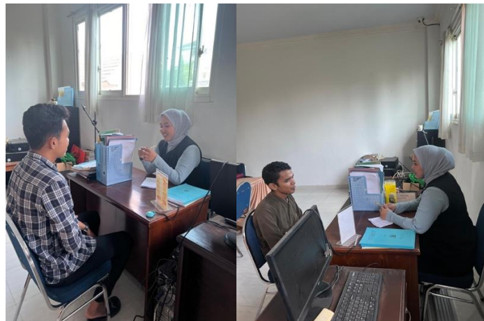
Gambar 1. Proses observasi dan Pengisian Pre-test

Keempat dimensi tersebut menjadi parameter utama untuk memantau transformasi pola pikir mahasiswa dari fixed mindset menuju growth mindset selama kegiatan berlangsung. Melalui instrumen ini, tingkat efektivitas intervensi diukur secara objektif untuk memastikan adanya peningkatan modal psikologis mahasiswa dalam menghadapi ketidakpastian pasar global. Tim pengabdian bertindak sebagai fasilitator yang membantu mahasiswa menggali akar permasalahan, seperti ketakutan akan kegagalan dan tekanan kompetisi digital. Untuk mengevaluasi efektivitas intervensi, digunakan teknik analisis kuantitatif dengan membandingkan hasil pre-test dan post-test guna mengukur persentase peningkatan pemahaman mahasiswa terkait strategi mitigasi risiko bisnis. Instrumen pre-test dan post-test disusun secara sistematis mengacu pada empat dimensi Psychological Capital (PsyCap), yaitu harapan, efikasi diri, optimisme, dan resiliensi. Kemudian, Interaksi dua arah dilakukan untuk memberikan ruang bagi mahasiswa untuk berbagi pengalaman dan merumuskan aspirasi mengenai bentuk dukungan mental yang dibutuhkan, sehingga lahir solusi yang relevan dengan kondisi nyata mereka. Keabsahan data dalam kegiatan pengabdian ini dijamin melalui sinkronisasi antara instrumen pengukuran kuantitatif dan fakta kualitatif di lapangan melalui observasi, wawancara serta FGD Bersama narasumber.