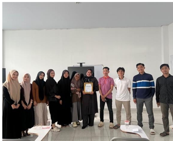
Gambar 5 . Foto bersama peserta Workshop