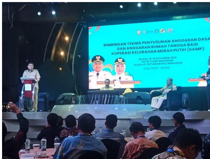
Gambar 1. Penyajian Materi

Untuk menilai efektivitas kegiatan, dilakukan evaluasi melalui pretest dan posttest terhadap delapan indikator pemahaman peserta mengenai fungsi AD/ART dan aspek integritas kelembagaan koperasi. Hasil evaluasi dapat dilihat pada gambar 2 yang menunjukkan bahwa seluruh indikator mengalami peningkatan setelah peserta mengikuti bimbingan teknis. Secara umum, peningkatan terjadi pada aspek pemahaman konseptual AD/ART, kemampuan mengidentifikasi elemen-elemen penting AD/ART serta pemahaman terhadap klausul-klausul strategis yang berkaitan dengan keanggotaan, struktur organisasi, mekanisme rapat anggota, pengawasan, dan pengelolaan konflik kepentingan.